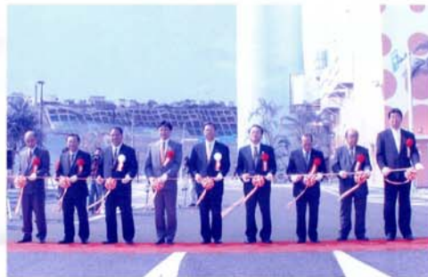
テープカットを行う関係者のみなさん