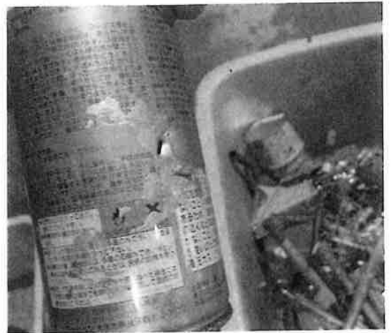
↑塗料が飛び出たスプレー缶