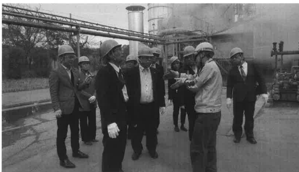
下水汚泥投入プラント