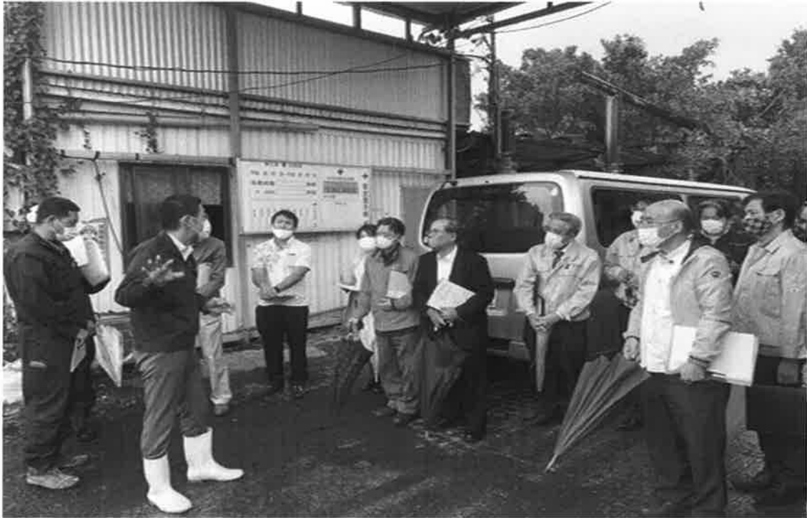
世名城工場(草木)・山城堆肥工場